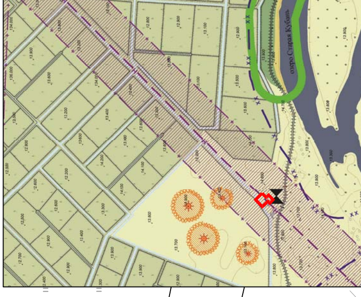
Схема расположения " земельного участка в окружении смежно расположенных земельных участков

Документация по планировке территории (проект межевания территории) для размещения линейного объекта: «Реконструкция Н «Тихорецк – Новороссийск - 1» для поставки дизельного топлива» Чертеж градостроительного плана земельного участка и линий градостроительного регулирования Масштаб 1:500