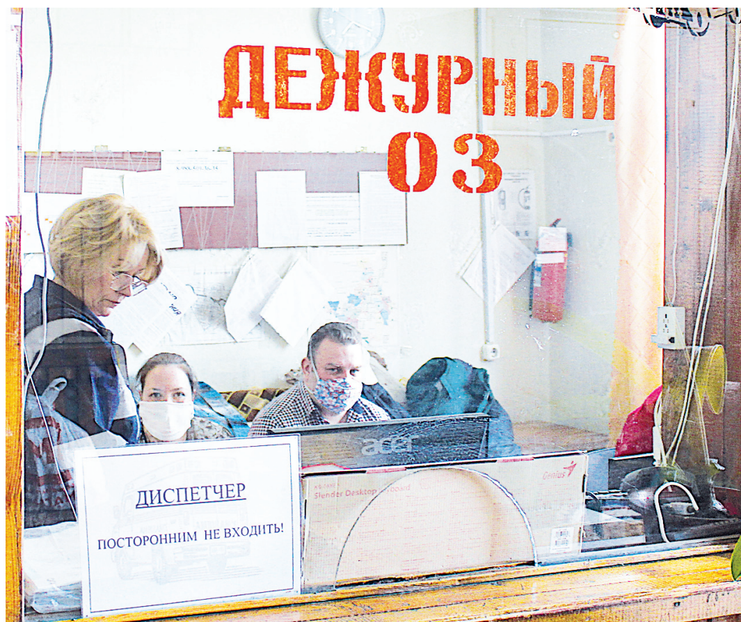
Диспетчерская «скорой».