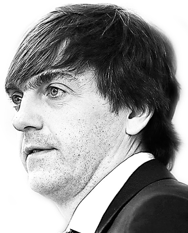
Сергей Кравцов.

По словам министра, тот бесценный опыт, который школа приобретает сейчас, будет использован для повышения качества образования. В том числе для детей, которые заболели, находятся дома. - Все те наработки, которые се-