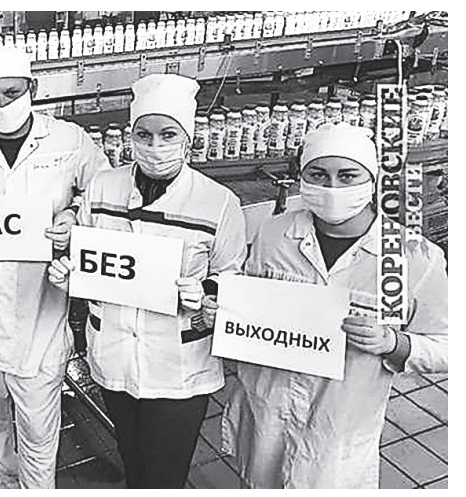
Работа Кореновского молочно-консервного комбината не останавливается ни днем, ни ночью, без праздников и выходных. Даже в условиях карантина его сотрудники делают все возможное, чтобы у людей на столе всегда были свежие, качественные и полезные молочные продукты. Они присоединились к флешмобу #мыработаемдлявасбезвыходных. Поддержим?