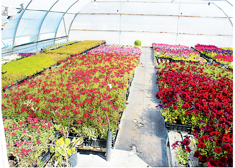
...И целое море цветов.