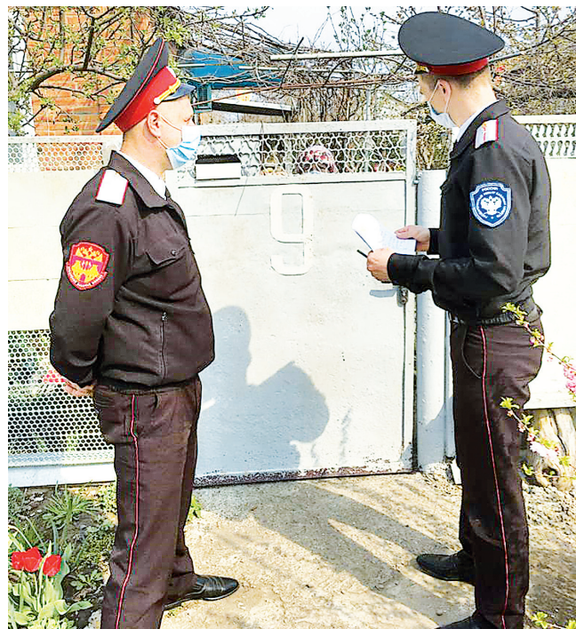
Мобильная группа в Кореновске.

В районе сформированы мобильные отряды из казаков Кореновского РКО, сотрудников полиции, Росгвардии и органов власти для контроля за соблюдением профилактических мер в связи с угрозой коронавируса.