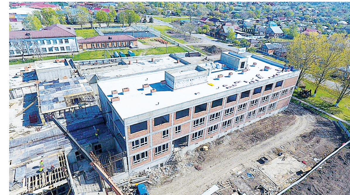
Строительство школы.