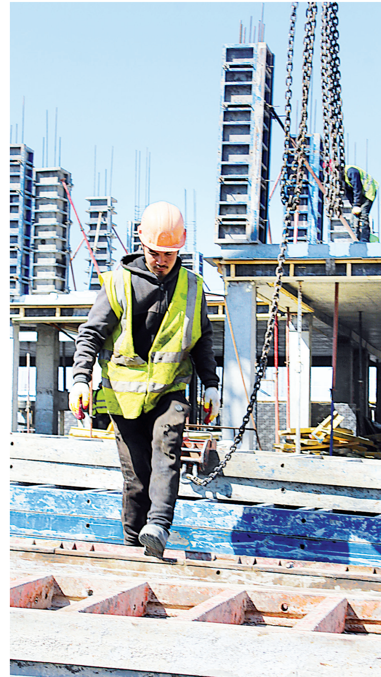
Строительство детского сада.

«Очень помогают и местная, и краевая администрации в решении всех наших актуальных вопросов, поэтому, я думаю, осенью новый детский сад будет готов», - подвел итог экскурсии по строительному объекту Константин Никандрович.