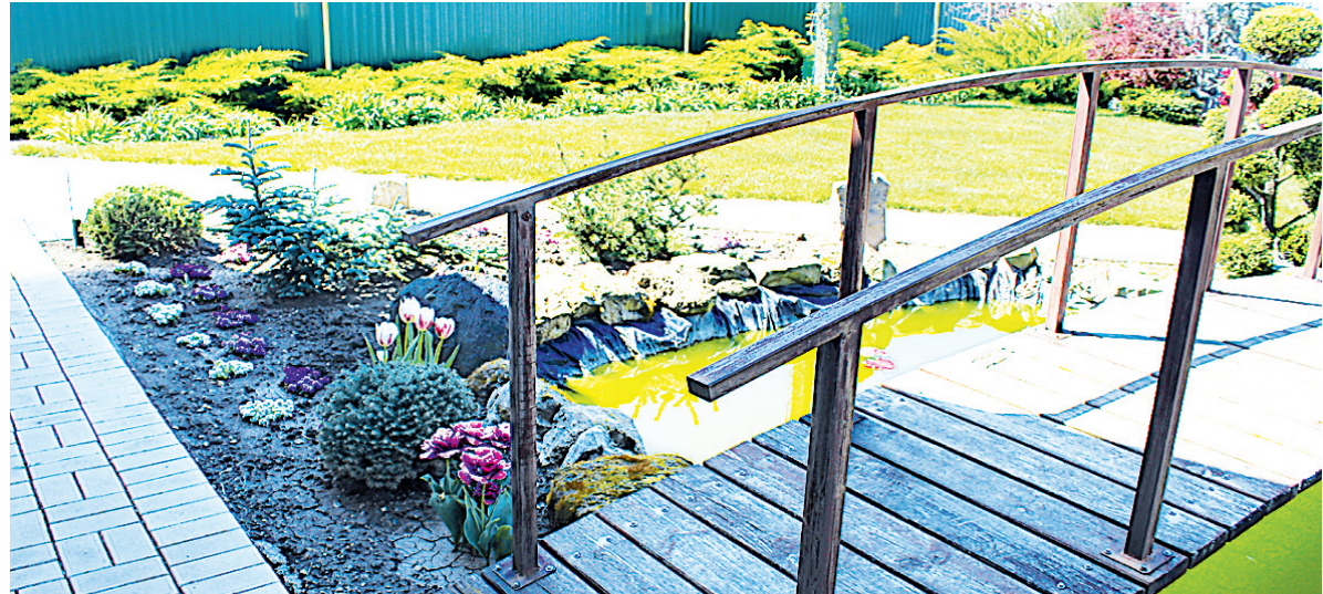
Правда красиво?